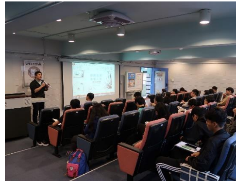
金融知識講座-享樂生活，負責人生 1081030