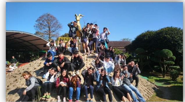
住宿賃居校外參訪-羊世界牧場 1081201