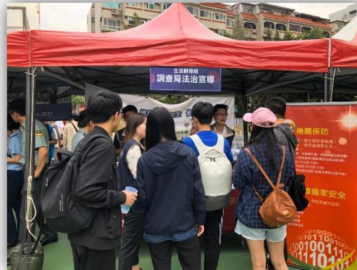
調查局反賄選及形象宣導 1081019