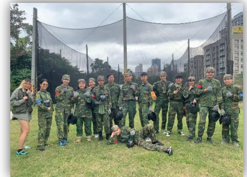
運動品德精神培養 1081218